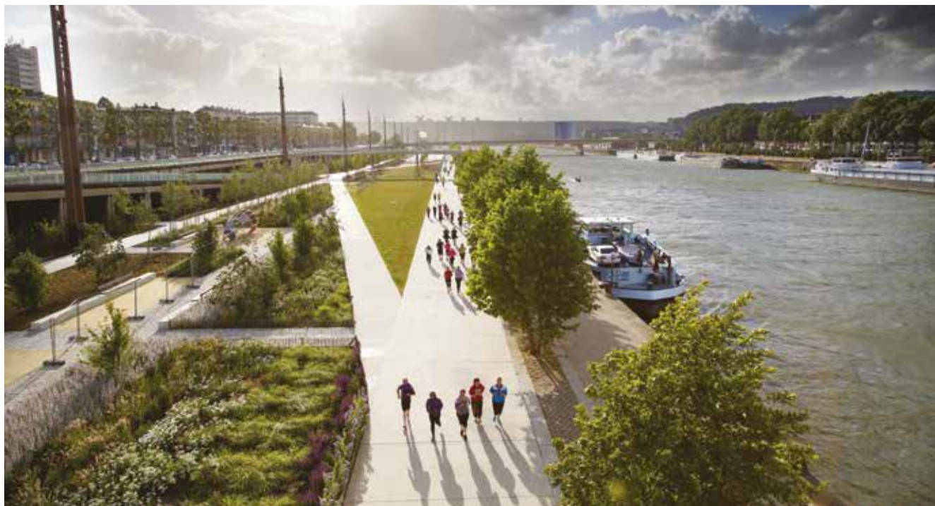
Grande promenade fluviale, quais de la Rive Gauche, Rouen (Grand prix national du paysage 2018)